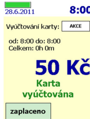
Vyúčtování při odjezdu